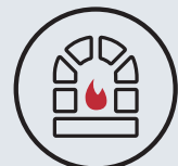
6. Isporuka sustava